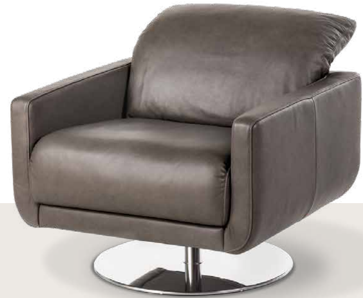
Bezug: Z79/94 graphite

Dieses Modell ist auch in Kombination verschiedener Bezugsqualitäten und -farben lieferbar.