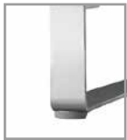
Metallkufe versch. Metallfarben