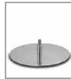
Drehteller Chrom glänzend