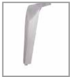
Metallfuß versch. Metallfarben außer silber