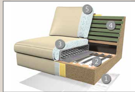
Das Design des hier abgebildeten Querschnitts entspricht nicht dem Modell dieses Katalogblattes.