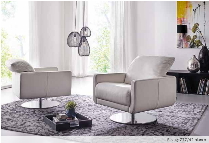
Bezug: Z77/42 bianco