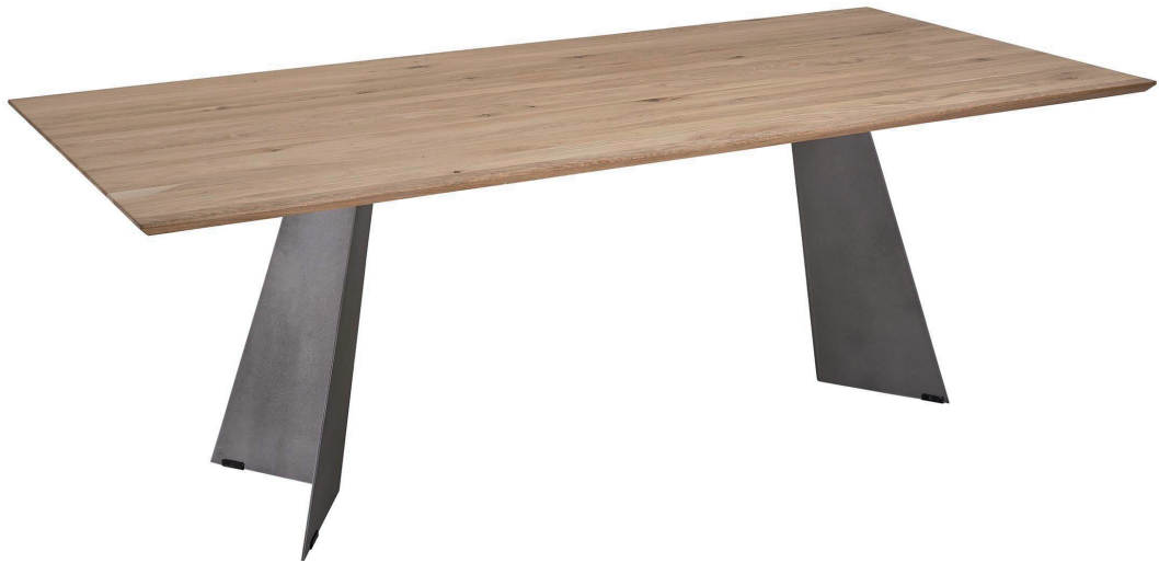
Abbildung 1E Tisch fix, Untergestell Farbton 2 Stahloptik pulverbeschichtet, Platte Massivholz Wildeiche bianco geölt